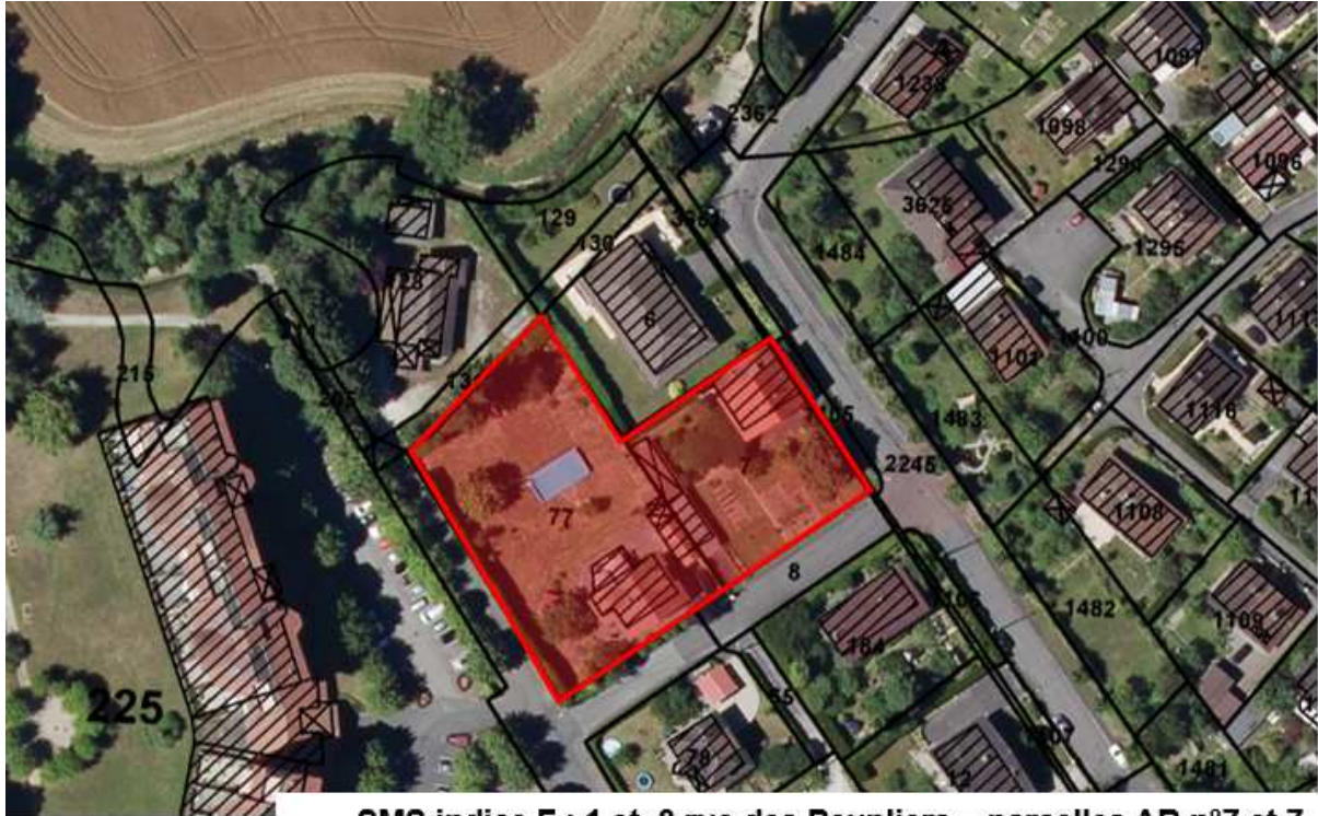
SMS indice F : 1 et 3 rue des Peupliers – parcelles AB n°7 et 77