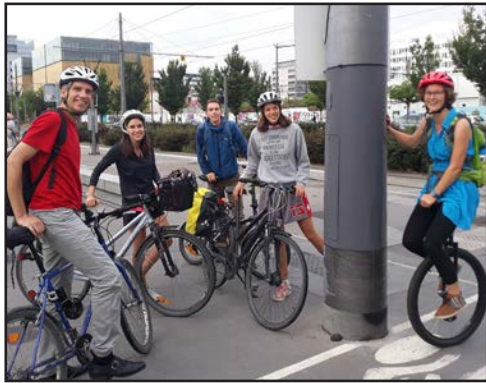
Tous les modes de déplacements écologiques sont permis, comme ici à Lyon en 2020.

Pour passer des paroles aux actes, nous vous proposons une journée de défi.