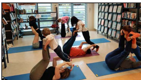
Atelier "Yoga conté" en mai 2021.

> Pour tout savoir sur les actualités et les animations de la Bimag, inscrivez-vous à sa newsletter en cliquant ici .