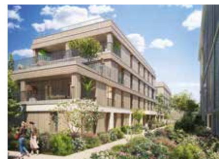
RÉSIDENCE BOUYGUES IMMOBILIER