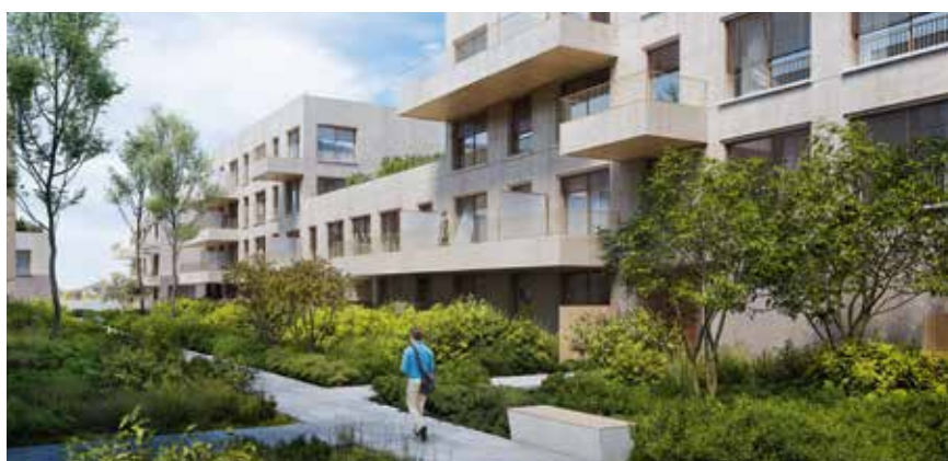
RÉSIDENCE HAUTE-SAVOIE HABITAT

Elle proposera des restaurants, des lieux de loisirs, un miroir d'eau, et de nombreux commerces et services.