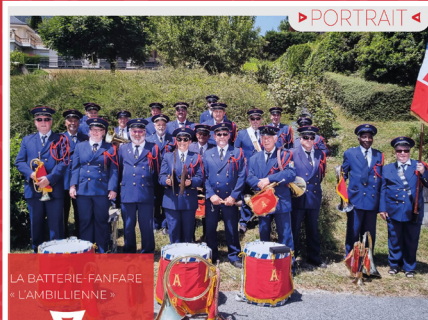
LA BATTERIE-FANFARE «L'AMBILLYENNE»

Vous êtes musicienne, musicien ? Votre enfant souhaite apprendre la musique ? Intégrez la Batterie-Fanfare !