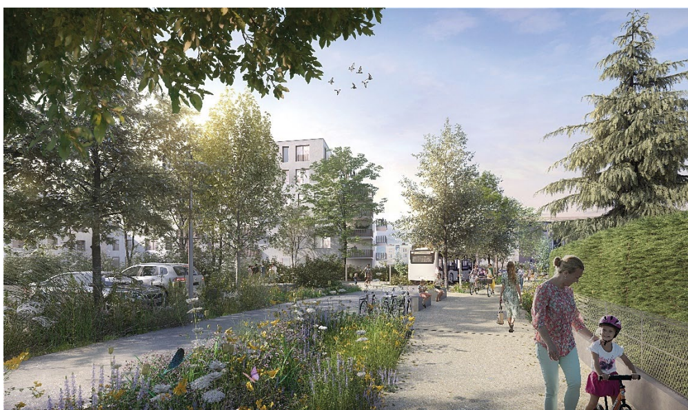
Rue des Ecoles (© Devillers et associés)

Rues concernées : Alpes, Écoles, Marronniers et Mont-Blanc.